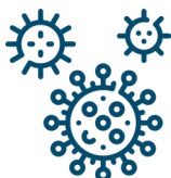
Viren & Bakterien