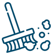
Haare & Großstaub