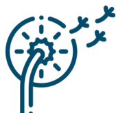
Sporen & Pollen